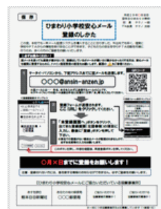
保護者向け登録用プリント

学校から保護者全員に配布される【学校安心メール®登録用プリント】に貴医院名を掲載をします。